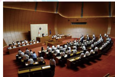
↑9月25日の採決の様子(本会議場)

9月定例会は、9月5日から10月9日までの35日間の会期で開催され、開会日に知事から、予算2件、条例5件、専決処分1件、契約18件など計35議案が提案されました。提案された主な条例案は、福岡県税条例及び福岡県宿泊税条例の一部を改正する条例、福岡県飲酒運転撲滅運動の推進に関する条例の一部を改正する条例、福岡県子ども審議会条例の一部を改正する条例などです。加えて、12日には、令和5年度一般会計決算議案など、令和5年度決算の審査に係る議案20件が追加提案されました。各常任委員会での審査を経て、9月25日に早期議決を要する議案の議決がなされ、いずれの議案も可決されました。その後、決算特別委員会の審査が行われ、最終日の10月9日に議案の採決が行われ、いずれの議案も可決されました。